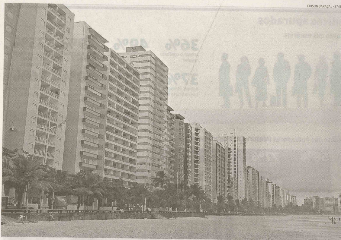
Os moradores de Guarujá que têm direito à isenção do IPTU em 2010 precisam fazer a solicitação de terça-feira até 30 de novembro

O atendimento nos dois locais será realizado de segunda a sexta-feira, das 10 às 16 horas. No momento do pedido, os requerentes devem estar documentados (veja relação no quadro ao lado)