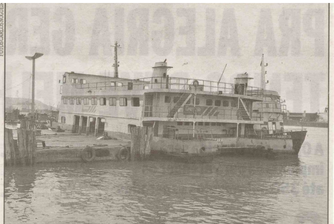
As duas barcas com maior capacidade estavam paradas: uma quebrada e outra esperando reforma