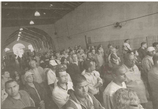
Enquanto os usuários lotavam o saguão de espera do terminal de Vicente de Carvalho...

Expresso Popular Domingo, 11 de Outubro de 2009